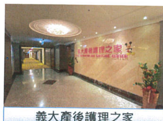
義大產後護理之家