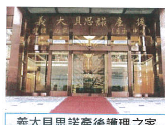
義大貝思諾產後護理之家