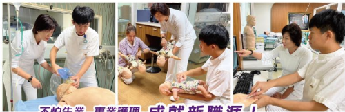
不怕失業 專業護理 成就新職涯!