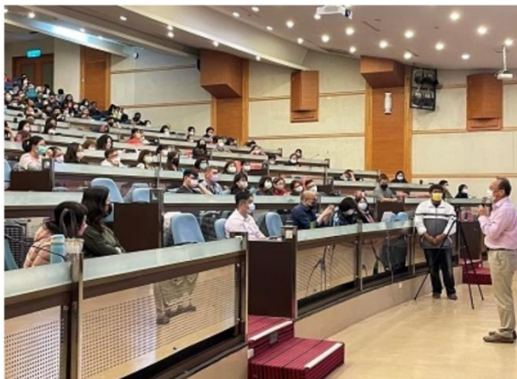
社工系辦理「110-2 碩士班、大學部在職班 師生座談會」 [社會工作系(含碩士班)]