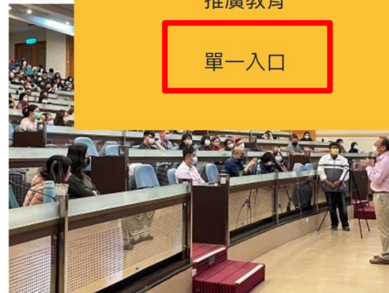
社工系辦理「110-2 碩士班、大學部在職班 師生座談會」 [社會工作系(含碩士班)]