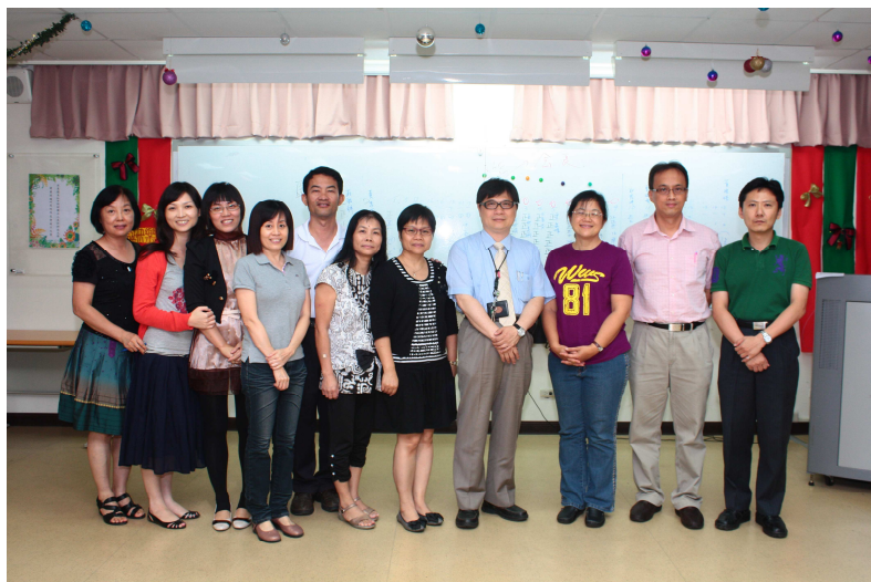
當選理監事人員合照