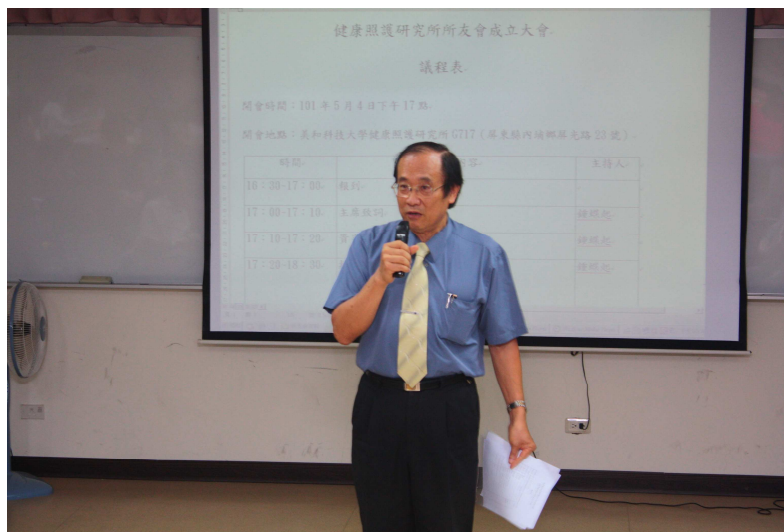
健照所鍾蝶起所長致詞